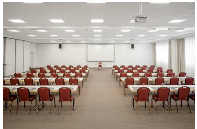
Fribourg, NH Hotel Freitag und Samstag, 19./20. Mai 2017