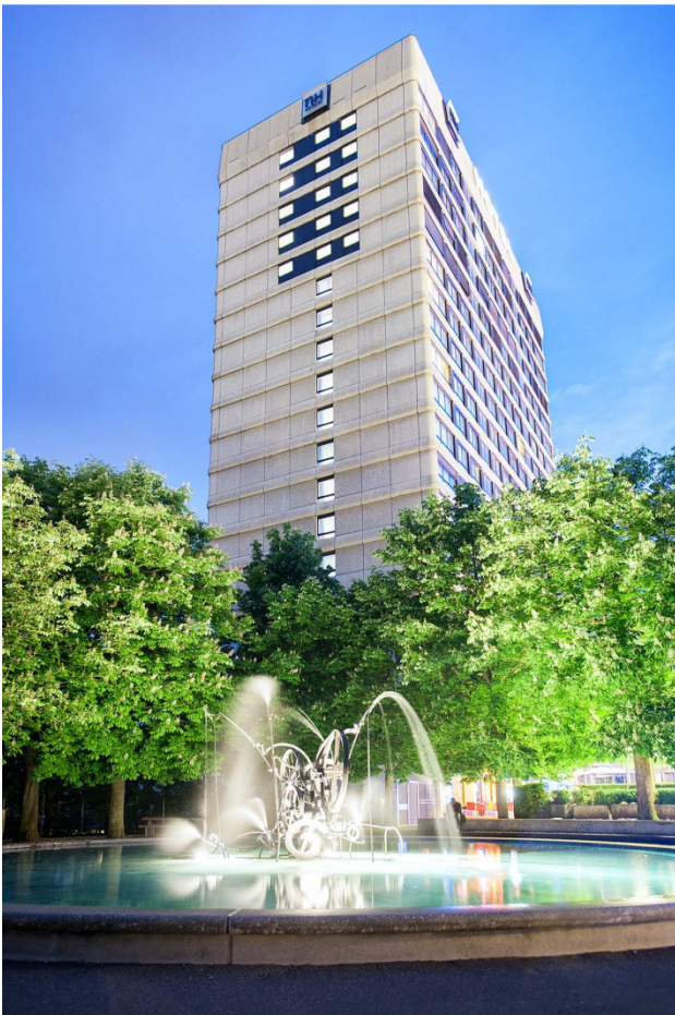
Fribourg, NH Hôtel Vendredi et Samedi 19/20 mai 2017